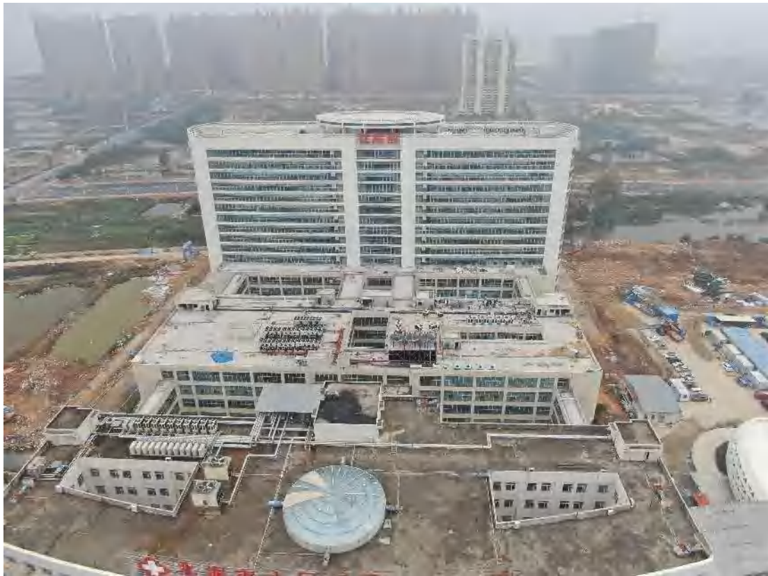
图 6 住院楼现状