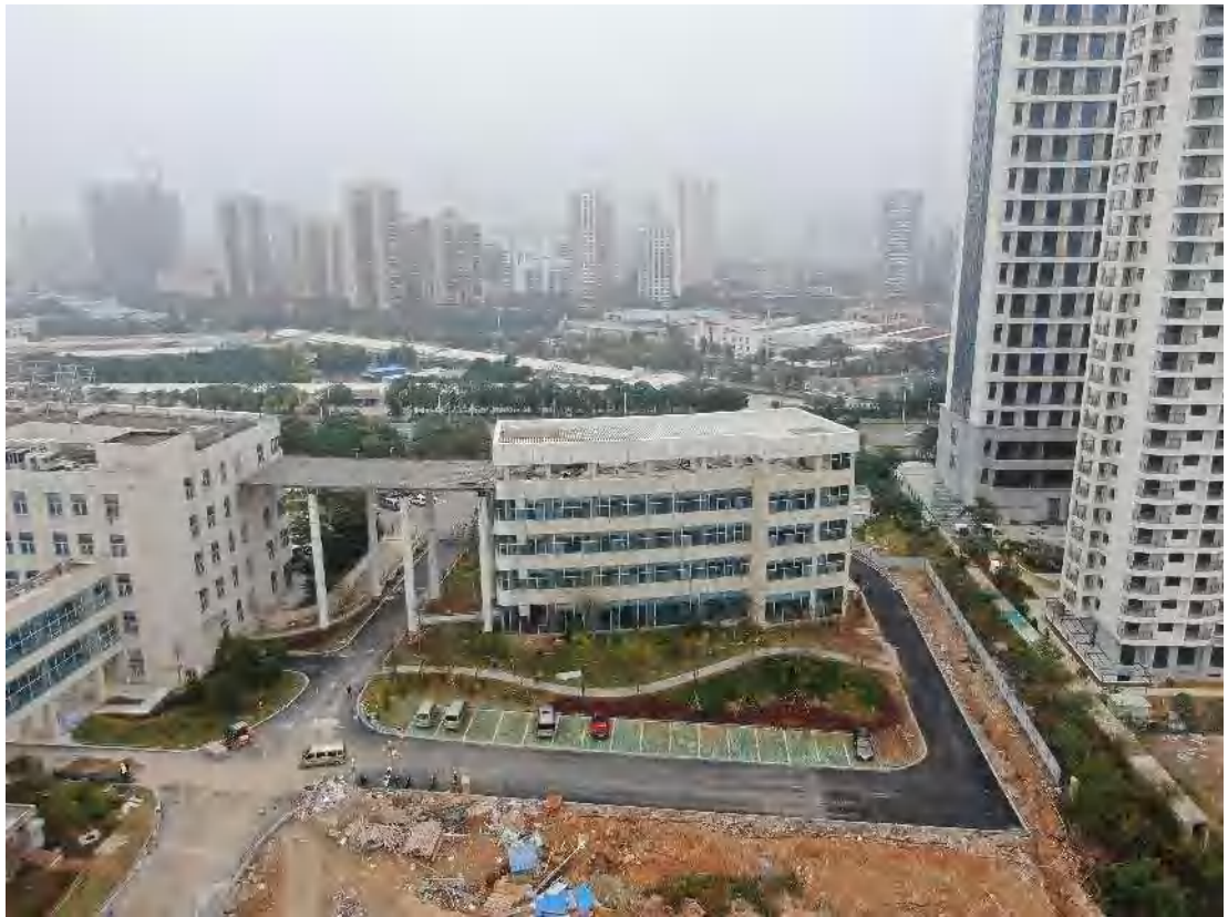
图4 东侧后勤保障楼现状