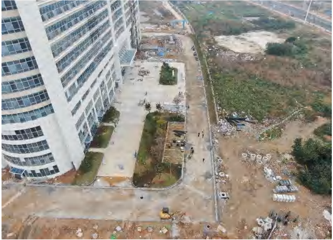
图3 项目区南侧现状