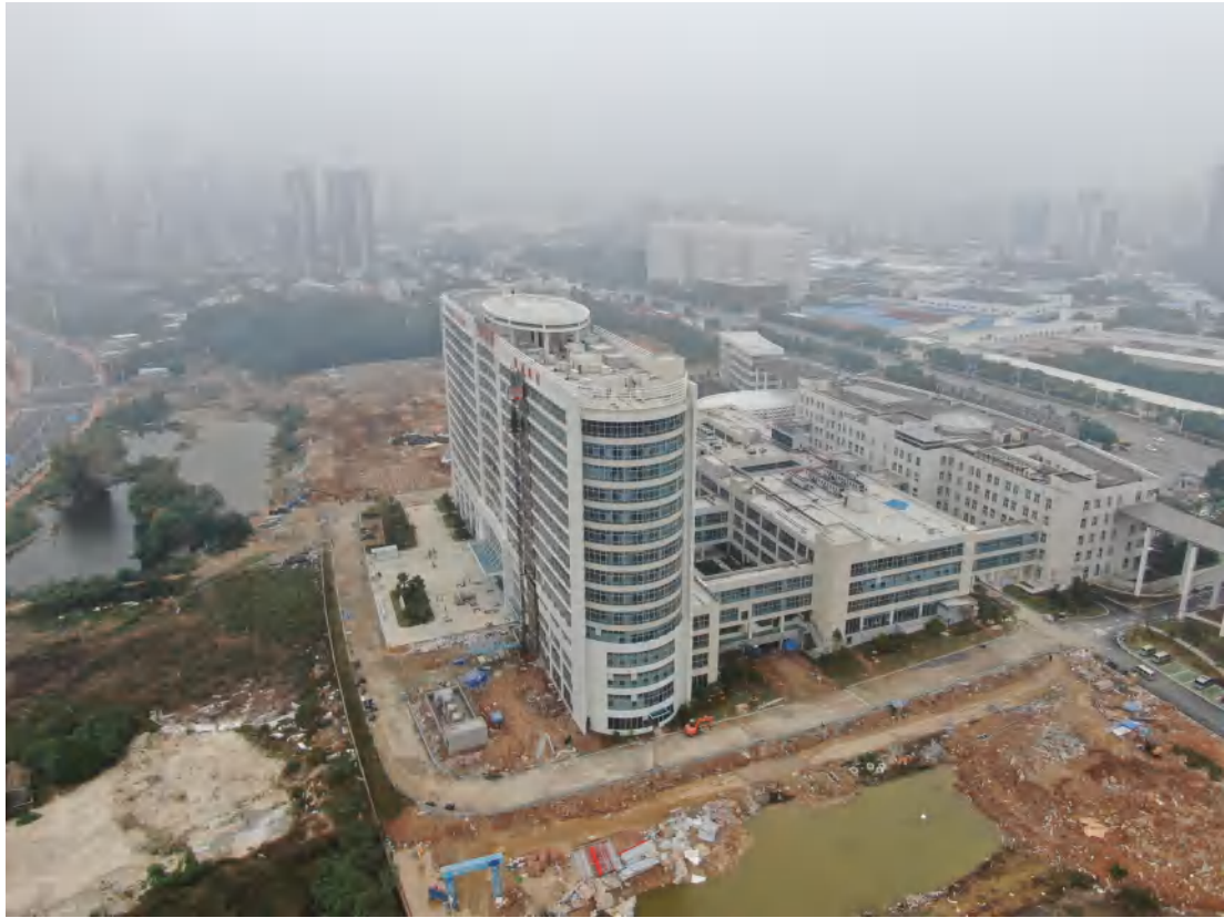
图 5 项目区东侧现状