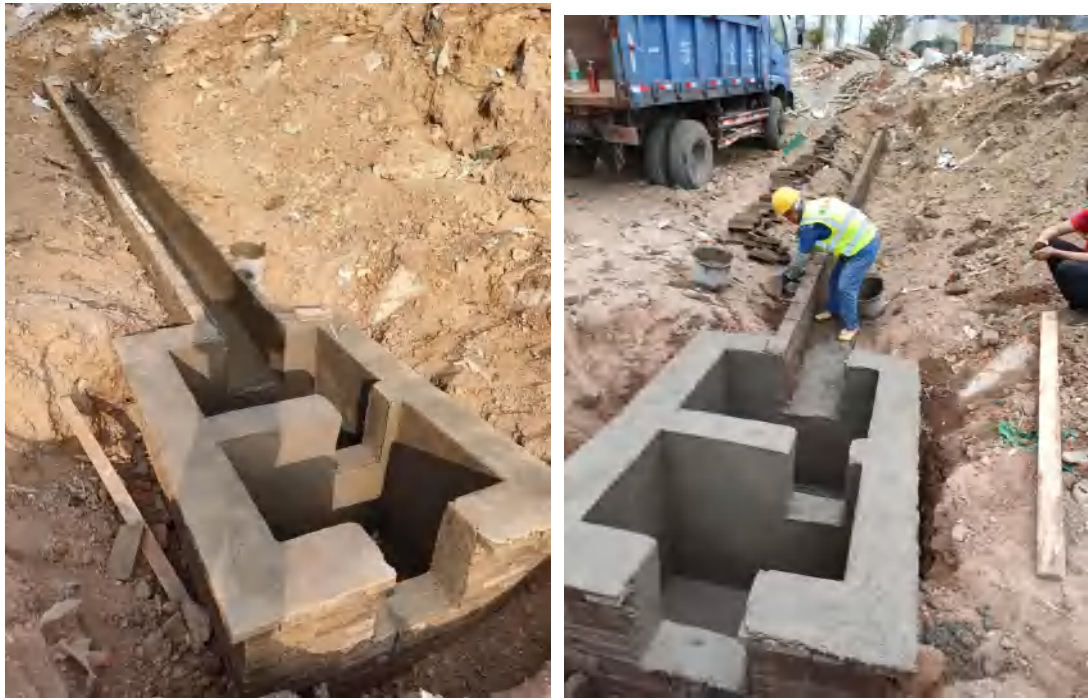
图 7 新增沉沙池及排水沟