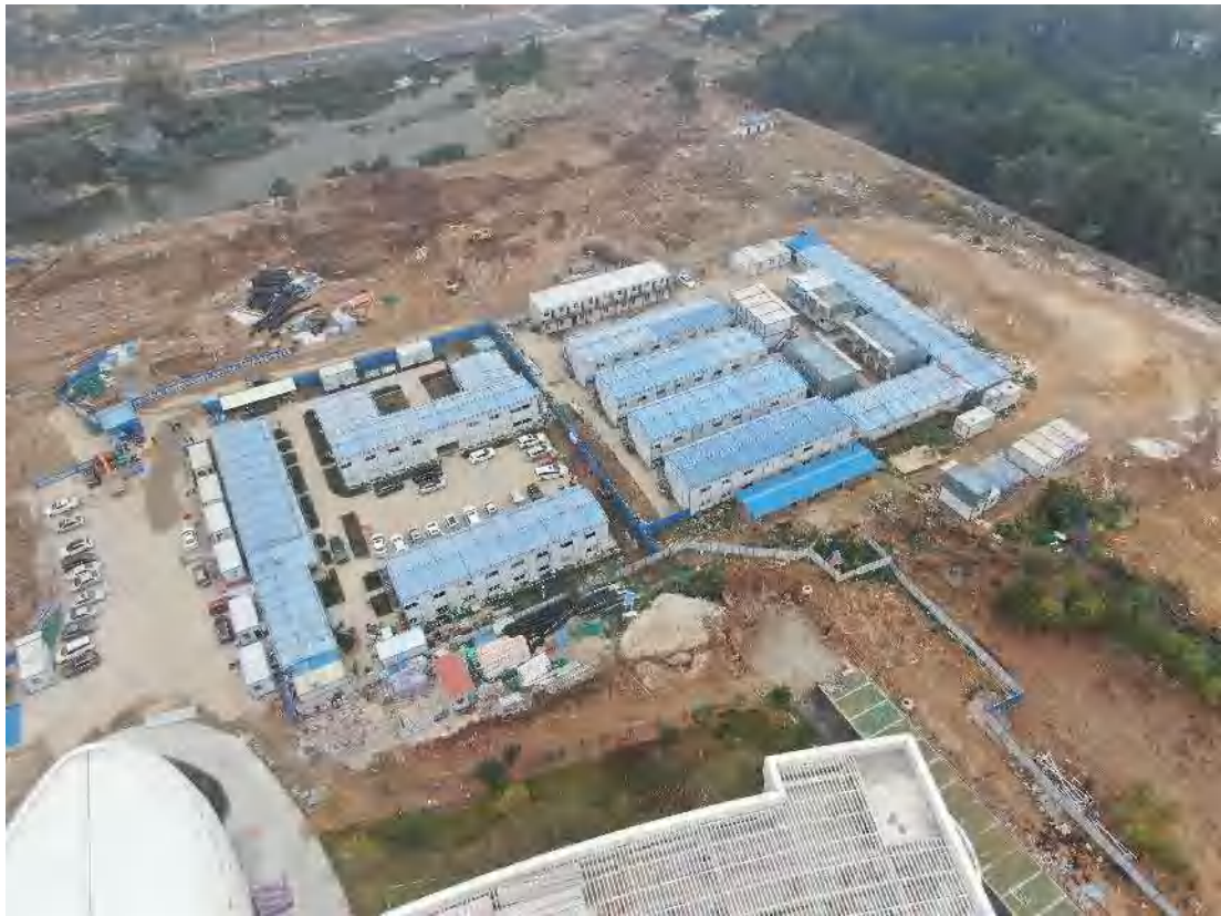
图 8 施工生产生活区