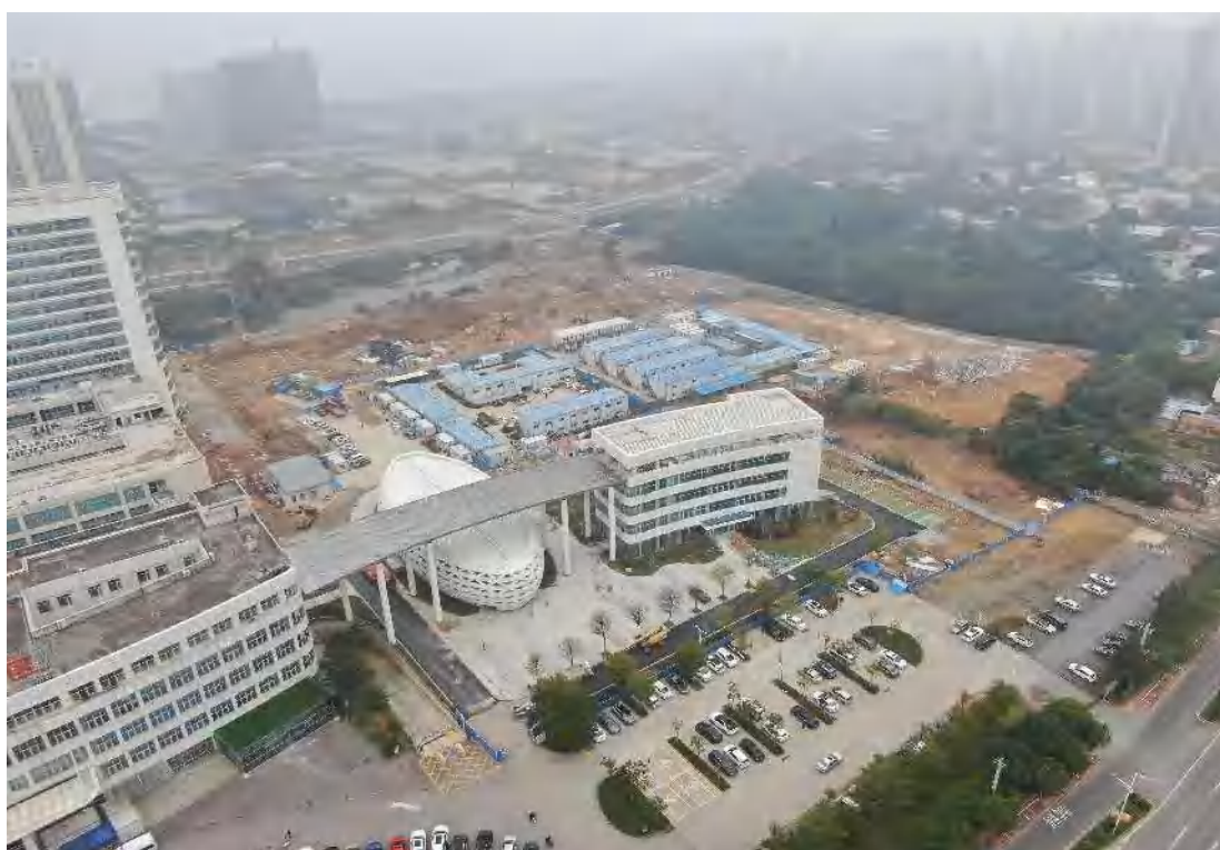
图 2 学术报告厅现状