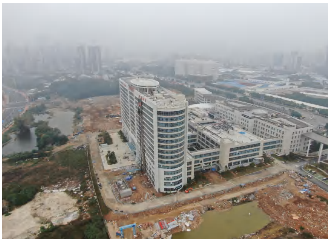
图 1 项目现状